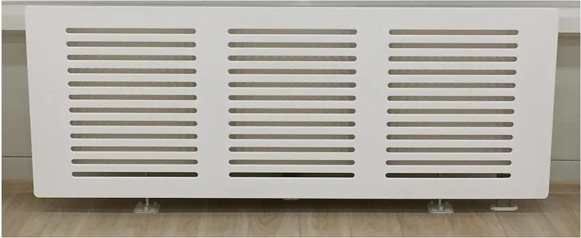
Rys. Schemat osłony grzejnikowej

Sposób mocowania: wg zaleceń producenta.